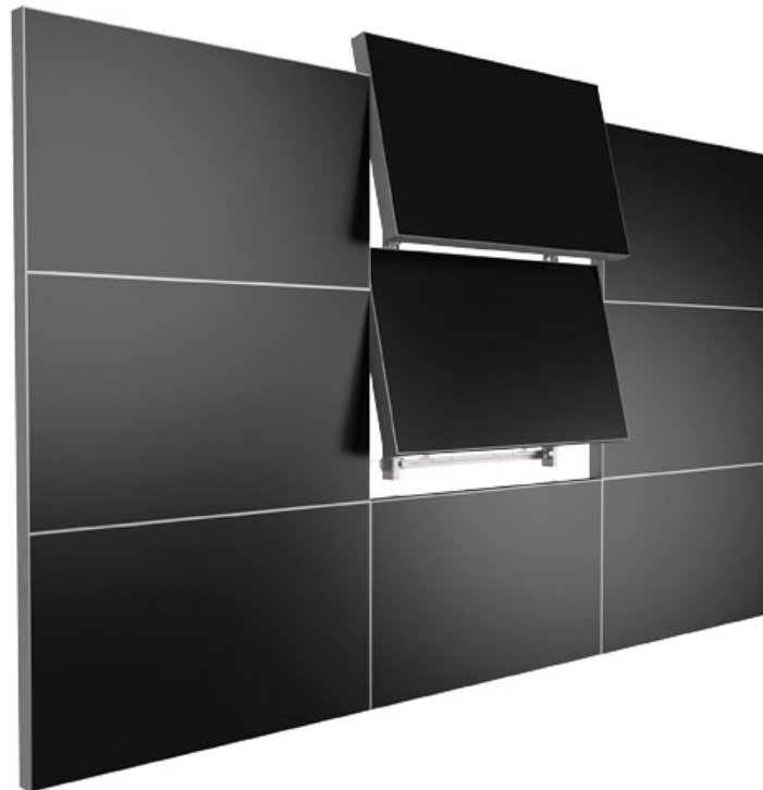
Matrix In-Wall Service Mode