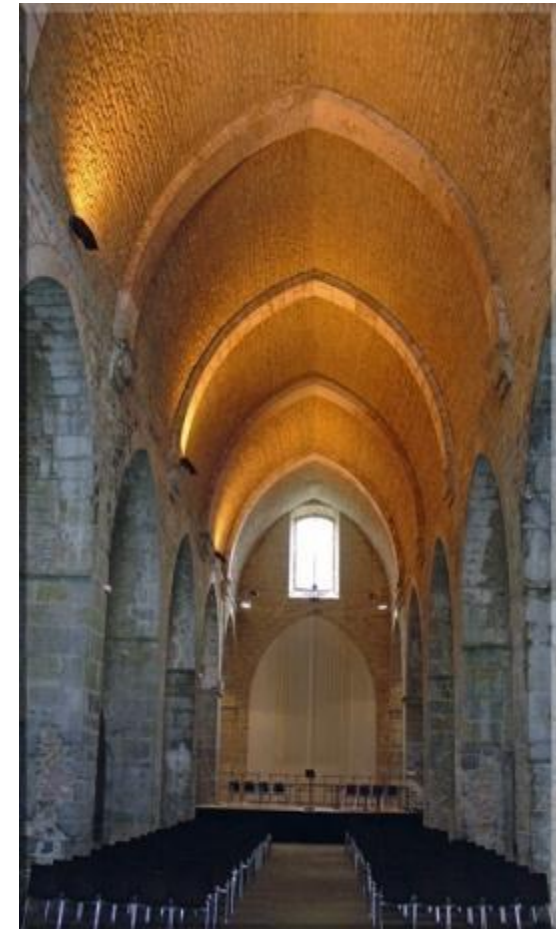
EL EDIFICIO DEL SIGLO XVII DEL LIVING LAB (EN RESTAURACIÓN)